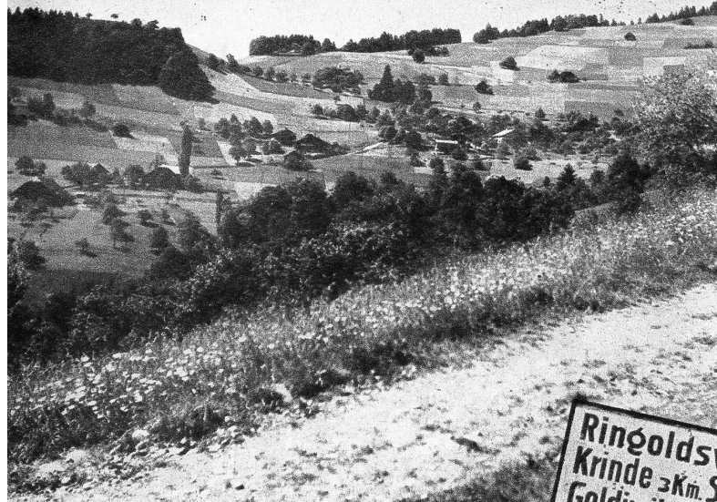
Links: Zwischen Wäldern und fruchtbaren Aeckern liegt Ringoldswil