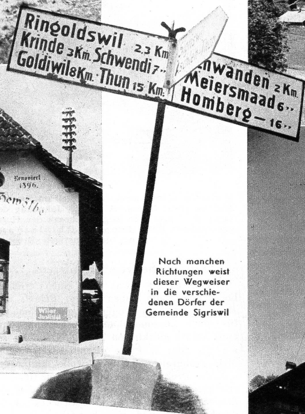
Nach manchen Richtungen weist dieser Wegweiser in die verschiedenen Dörfer der Gemeinde Sigriswil