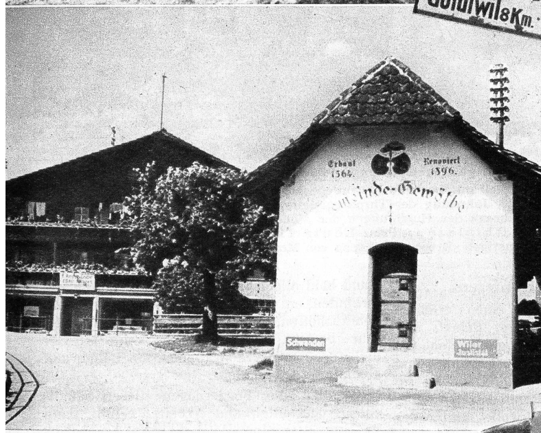
Das Gemeindegewölbe von Sigriswil, wo der Freiheitsbrief aufbewahrt wird