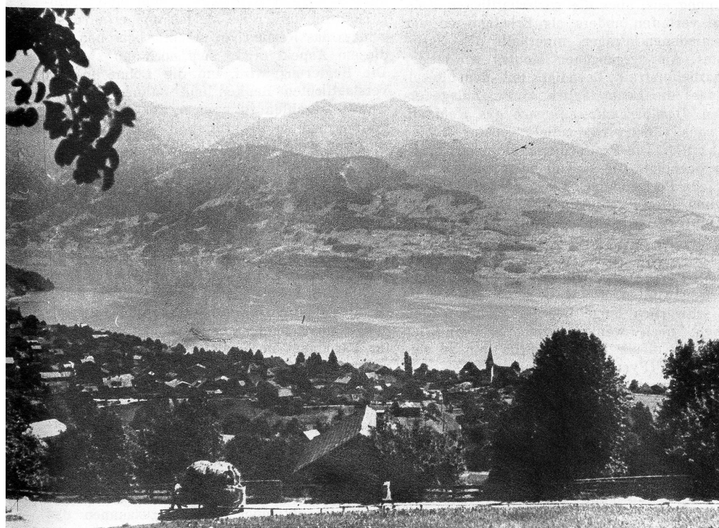
Oben: Blick von Tschingel auf Sigriswil und den Thunersee — Rechts: Weit auseinander liegen die Häuser von Tschingel am Fusse des Sigriswilergrates