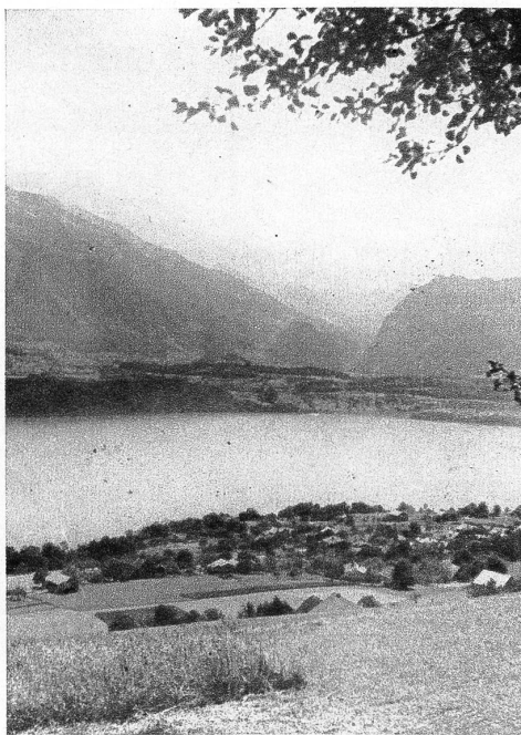
Auf der ersten Terrasse ob dem See liegt Aeschlen inmitten schöner Obstbäume