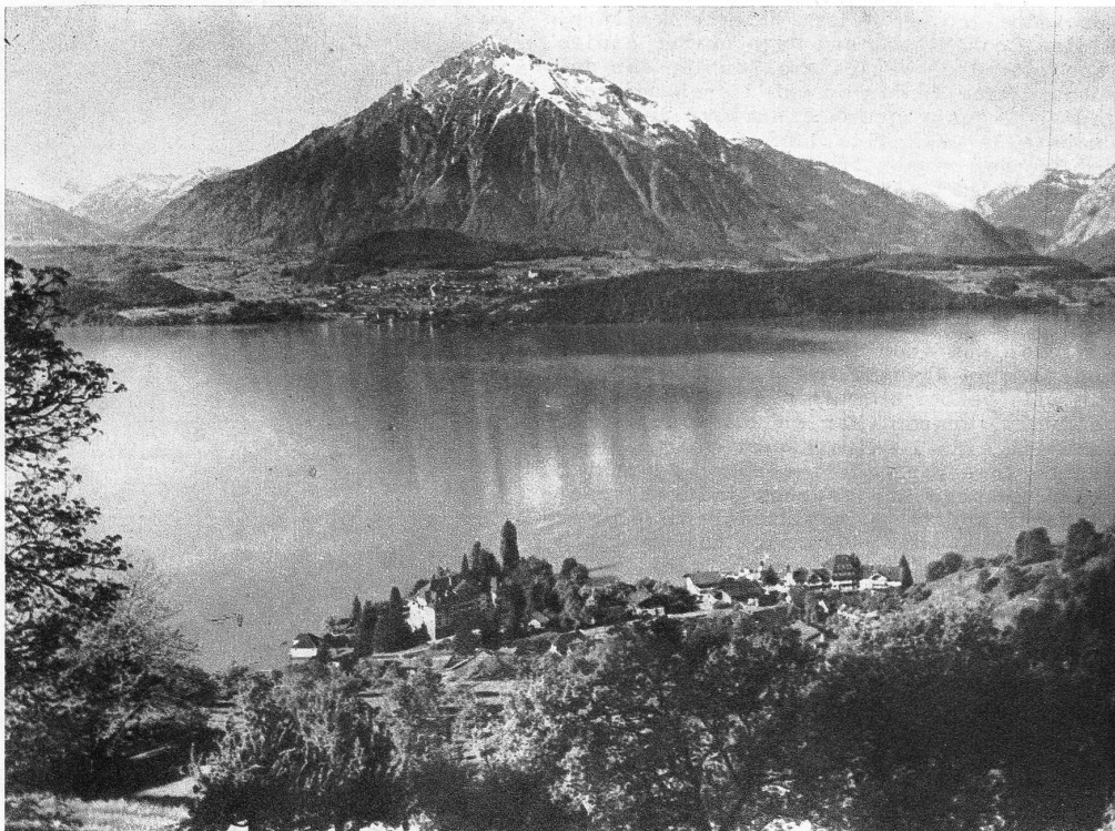
Gunten am Thunersee, von wo aus man nach Sigriswil gelangt, hat sich in den letzten 50 Jahren zu einem beliebten Kurort entwickelt

Bubenberg, welcher damals die glückliche Vollendung des Sieges über den