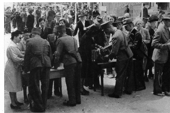
Basler Masseninvasion nach Lörrach