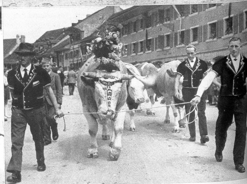
Einer der Wärschaftesten des Umzuges, ein prachtvoller Muni