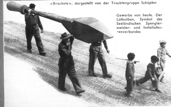
Gewerbe von heute. Der Lölkolben, Symbol des Seeländischen Spenglermeister- und Installateurverbandes