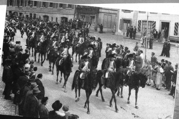
Dragoner aus der Uebergangszeit (Reitverein Biel und Umgebung)