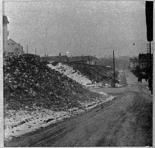
Ein Rest des früheren Bahndammes