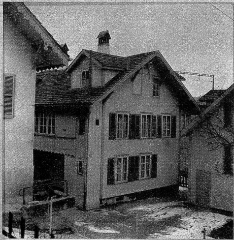
Häusergewirr aus der ersten Bauzeit des Quartiers