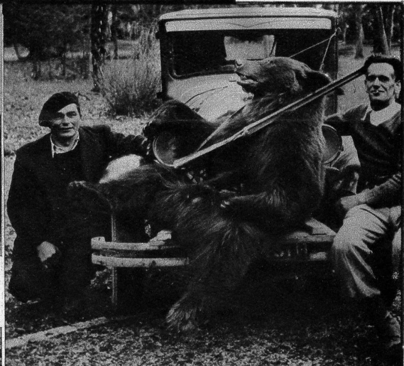
Bärenjagd im Jahre 1947. — Am 10. März konnte im Etsching-Tal in den Pyrenäen ein Braunbär geschossen werden, der ein Gewicht von 133 Kilo aufwies. Sein Alter wird auf 6 bis 8 Jahre geschätzt