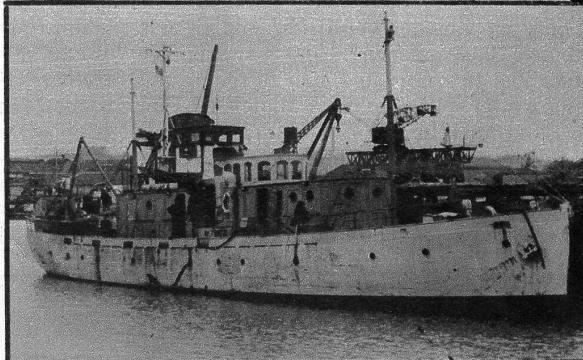
Rommels Privatjacht befindet sich heute in französischem Besitz und wird für den Langustenfang eingesetzt. Unser Bild zeigt das Schiff im Hafen von Argachon