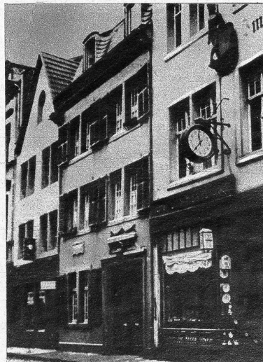
Strassenansicht von Beethovens Geburtshaus in Bonn, das als Beethoven-Museum eingerichtet wurde

Holland und als 11- und 12jähriger gibt er bereits die ersten Klaviervariationen heraus. Die letzten Unterrichtsweihen soll der begabte Knabe beim grössten lebenden Meister, bei Mozart, erhalten und 1787 reist er mit Unterstützung des kurkölnischen Hofes nach Wien, muss aber wegen der Mutter Tod sein Studium unterbrechen und kann erst 1792 wieder nach Wien zurückkehren. Nun ist aber nicht mehr Mozart, sondern Josef Haydn sein Lehrmeister. Dann erwirbt sich Beethoven als Klavierspieler grossen Ruf, hinzu aber steht er binnen weniger Jahre in der ersten Reihe der schaffenden Musiker, und im März 1795 ist der Meister als Spieler eines eigenen Klavierkonzertes in Wien öffentlich aufgetreten. Nun beginnen Konzertreisen durch