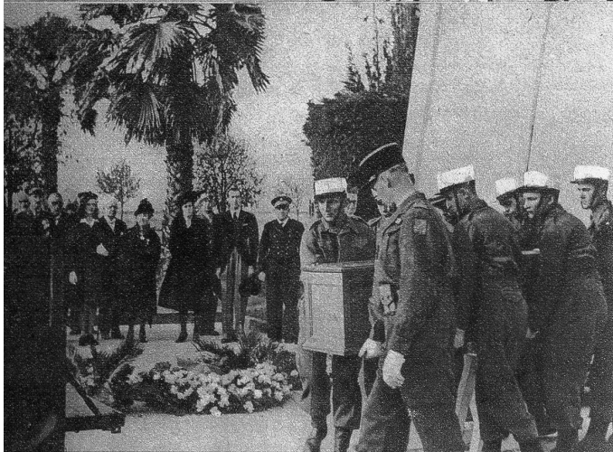
Oberes Bild: Ein Detachment Fremdenlegionäre nimmt in Casablanca von seinem ehemaligen Kommandanten vor dessen Ueberführung nach Algerien Abschied