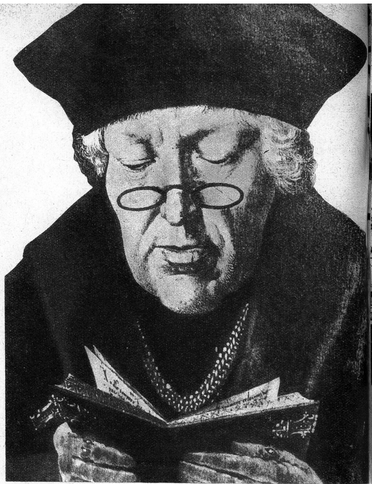
Bügelbrille (aus Horn) mit starrem Steg, auf einem Porträt des Thomas Morus aus der Werkstatt Hans Holbeins d. J., Anfang 16. Jahrhundert. Während die Nietbrille noch aus zwei auseinandergeklippten Stielgläsern besteht, sind bei der Bügelbrille die beiden Teile bereits durch einen festen Steg miteinander verbunden.