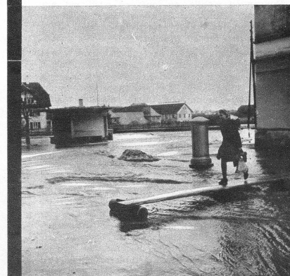
Der vollständig überschwemmte Neuhausplatz im Liebefeld. Das «Fadenspüli», die Omnibushaltstelle, ragt hinaus aus den Fluten