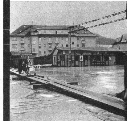
Von den Geleiseanlagen bei der Station Liebefeld war keine Spur mehr zu sehen