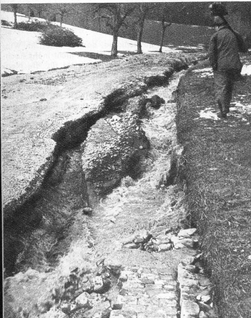
Das Strässchen Neuenegg-Brüggelbach wurde stellenweise fast vollständig weggerissen