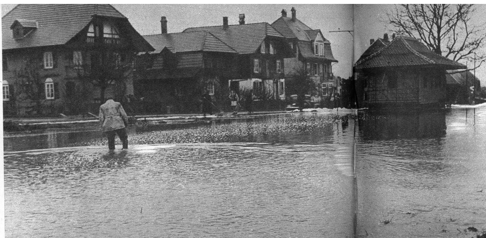
Die trüben Fluten, die von Zollikofen her über das sog. Seedorffeld und die Hauptstrasse anliefen, überschwemmten in Moosseedorf den Stationsplatz bis zu einem halben Meter tief