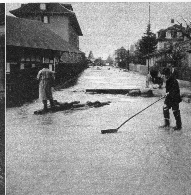
Hier, an der Brunnmattstrasse, liegt irgendwo die Transchiene verborgen