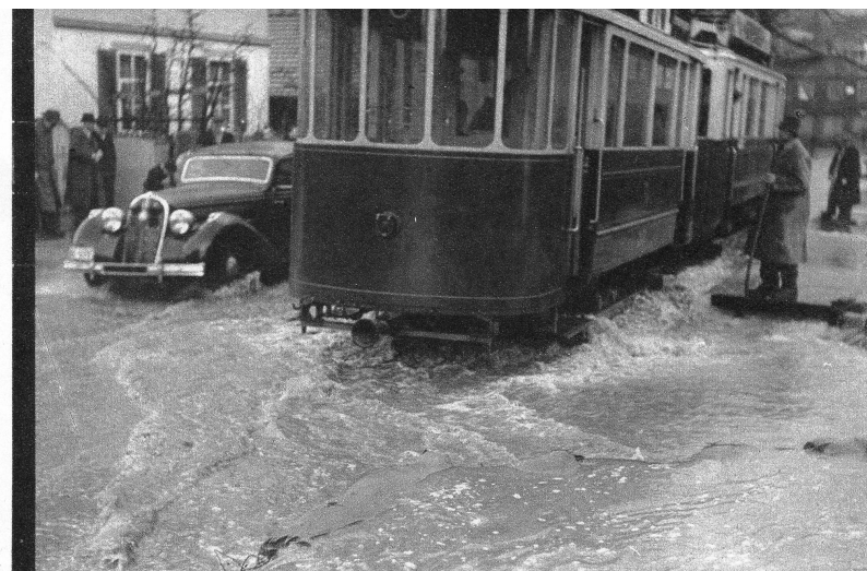
Die Ueberschwemmung des Sulgenbaches an der Brunnmattstrasse in Bern. - Strassenbahn und Autos suchen sich vorsichtig einen Weg durch die Fluten der Brunnmattstrasse