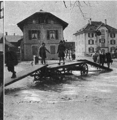
Notsteg über den reissenden «Hauptstrass-Fluss» in Köniz-Dorf