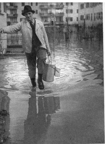
Wohl dem Milchmann, der mit Gummistiefeln ausgerüstet war! Bild aus Bümpliz, wo sich zwischen den einzelnen Häuserblocks ein einziger See ausdehnte