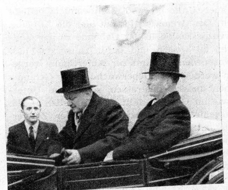
Regierungsrat Seematter und Regierungsrat Stähli begeben sich zu einem offiziellen Empfang