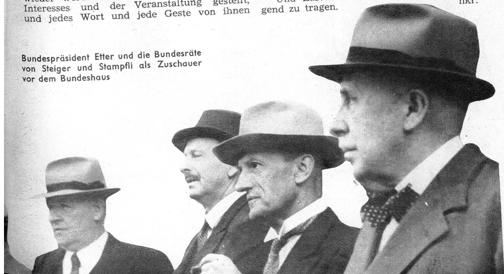
Bundespräsident Eter und die Bundesräte von Steiger und Stampfli als Zuschauer vor dem Bundeshaus