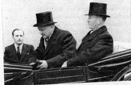
Regierungsrat Seematter und Regierungsrat Stähli begeben sich zu einem offiziellen Empfang