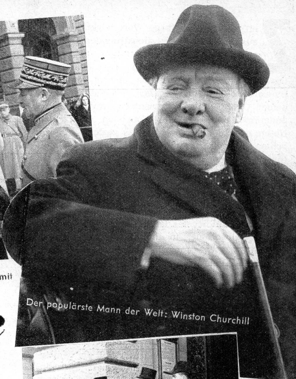
Der populärste Mann der Welt: Winston Churchill