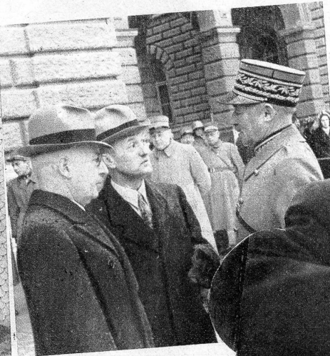
General Guisan im Gespräch mit Bundespräsident Etter und Alt-Bundesrat Wetter