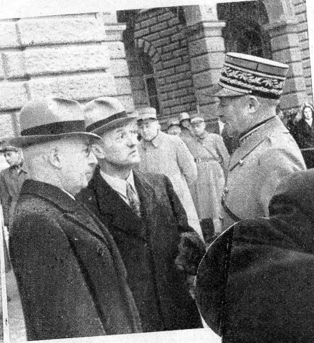
General Guisan im Gespräch mit Bundespräsident Eter und Alt-Bundesrat Wetter