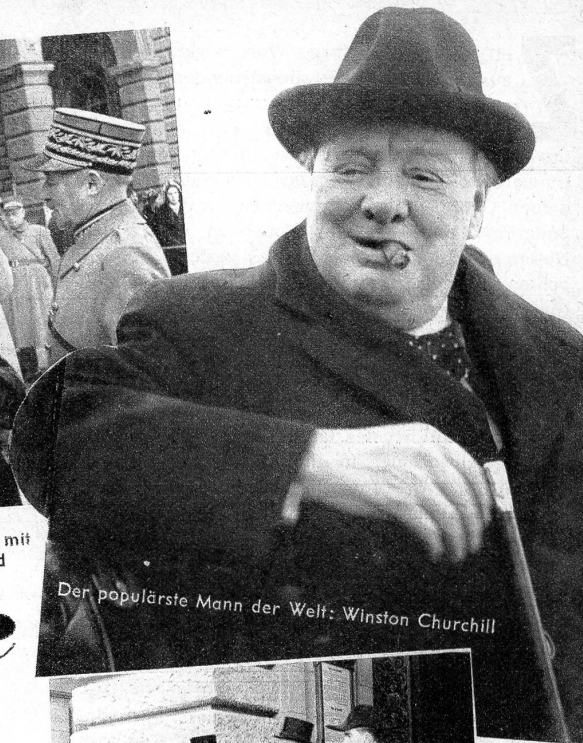
Der populärste Mann der Welt: Winston Churchill