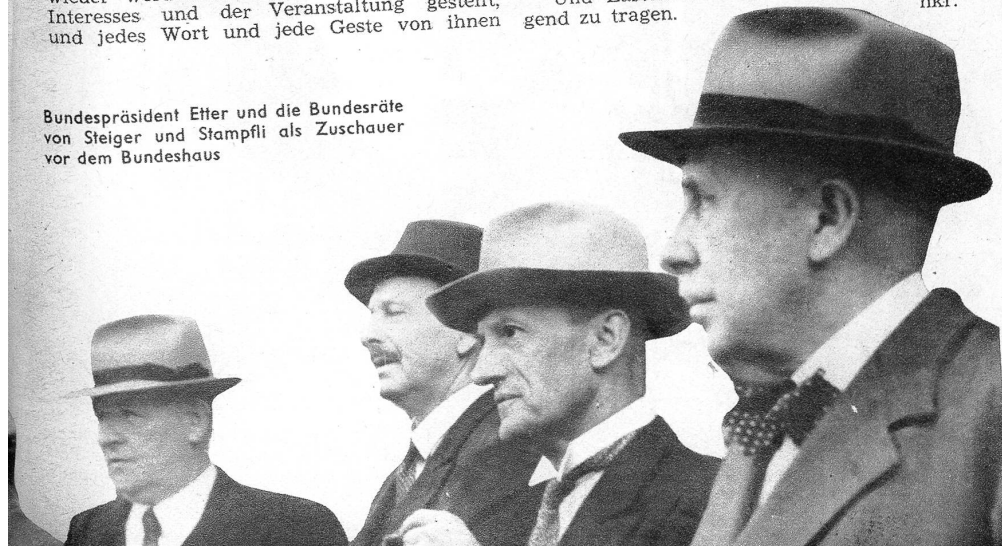
Bundespräsident Etter und die Bundesräte von Steiger und Stampfli als Zuschauer vor dem Bundeshaus