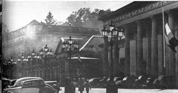
Kleinautos und die einst so arg verachteten Volkswagen sind vor dem Kasino parkiert

Der Dienst ist um 12 zu Ende und beginnt um 2 wieder. Nach dem Essen, das in der Popote des Sous-Officiers eingenommen worden war, will man wissen, was ennet dem Rhin, en France, geschieht. Selbst im Winter trägt die Französin keine Strümpfe