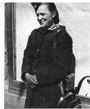
Wahrscheinlich ist sie so unverschämt glücklich, weil sie noch eine Uniform tragen darf, und wenn es nur jene der Strassenbahnschaffnerinnen ist

Die französische Organisation läuft nun, und jene Offiziere, die keine waren und irgendwo ein Bureau aufmachten und irgendwelche Bewilligungen verkaufte, sind wieder ver-