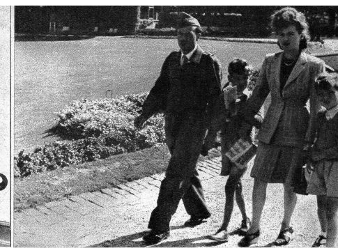
Maman, Papa et les deux fils kommen vom Mittagessen im Offizierskasino