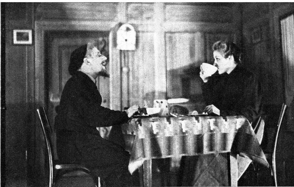
Jöggu und Mädi in einer Szene des fröhlichen Stückes «D'Stocklichrankheit» von Kari Grunder