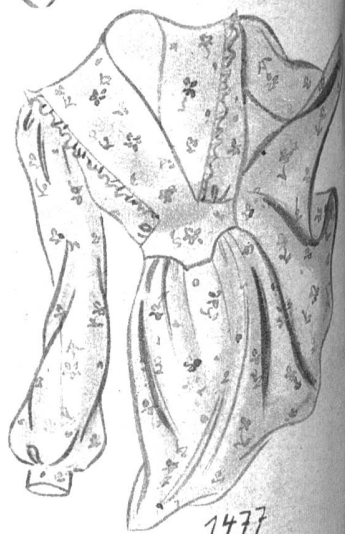
1477. Nachthemd mit kleiner Vorderpartie. Die Taille wird hochgeciert