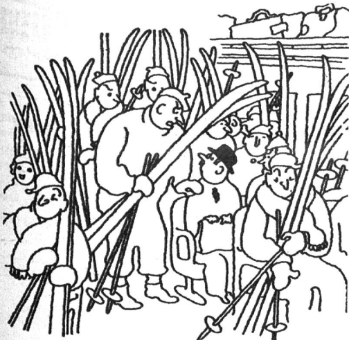
Im überfüllten Sportzug «Sagen Sie mal, Herr, ist Ihre Reise unbedingt notwendig?»