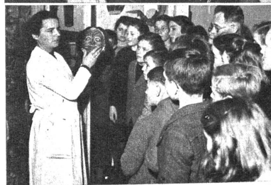
Die Führerin erzählt von Ahnenkult und Geistesreligionen. Das Nagelfelsch aus Loos soll besonders zueinander kräftig sein. Jedem solchen Felsch wird ein besonderer Wunsch gegeben, um dessen Erfüllung der Geist angefleht wird