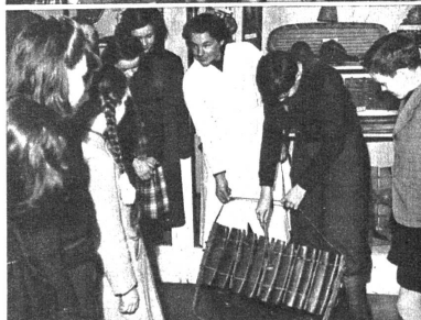
Melodie und Rhythmus nehmen konkrete Form in der Phantasie der Kinder an. Tanzende Urvölker und monotoner Urwaldmusik lebt vor ihnen auf. Ein Schüler darf eine Melodie ausprobieren