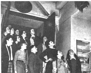
Voller Erwartung drängen sich die Kinder um die Konservatorin. Welch fremde Welt lebt hier auf! Erinnerungen an Lektüre von Karl May und andern erhalten hier eine lebensnahe Illustration

Winzern ist bekannt, dass vor einer Aenderung des Wetters in den Weinfässern kleine Luftbläschen hochsteigen, die ein schwaches, aber gut vernehmbares Sausen hervorrufen. Der Wein ist nämlich ein Wetterprophet, und manche Forscher vertreten die Ansicht, dass diese merkwürdige Eigenschaft auf atmosphärische Elektrizität zurückzuführen ist.