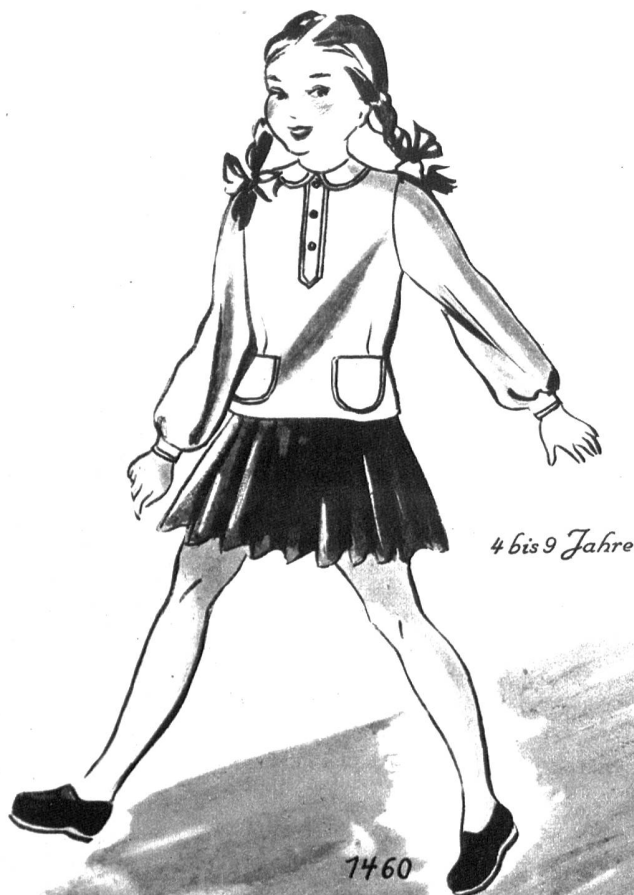
4 bis 9 Jahre