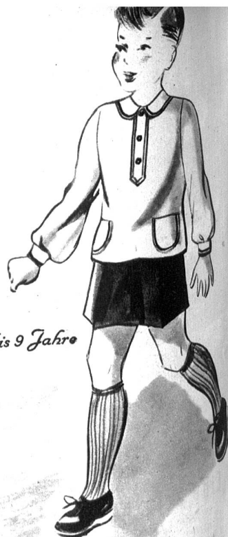
4 bis 9 Jahre

1460 und 1463. Es sieht nett aus, wenn Brüderlein und Schwesterlein gleich gekleidet sind. Wir zeigen hier ein einfaches Kasakblusli, das mit farbigen Tressen verziert ist. Dazu wird ein dunkelblaues Höschen oder ein Faltenjupe getragen