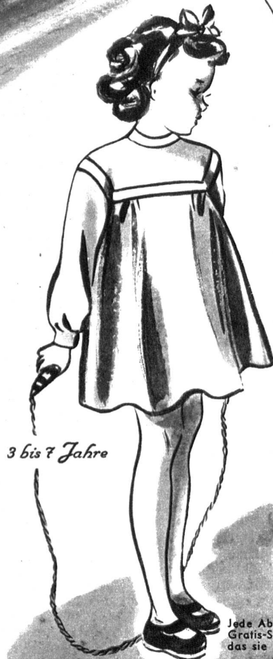
3 bis 7 Jahre