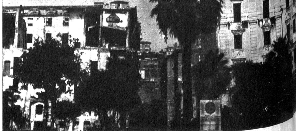
La Spezias Wasserfront ist vollständig zerstört

Gefährlich ist die Gegend der Toskana. Dort treiben nicht nur italienische Banditen, sondern auch amerikanische Deserteure ihre Räuberhandwerke und in den Pinienwäldern