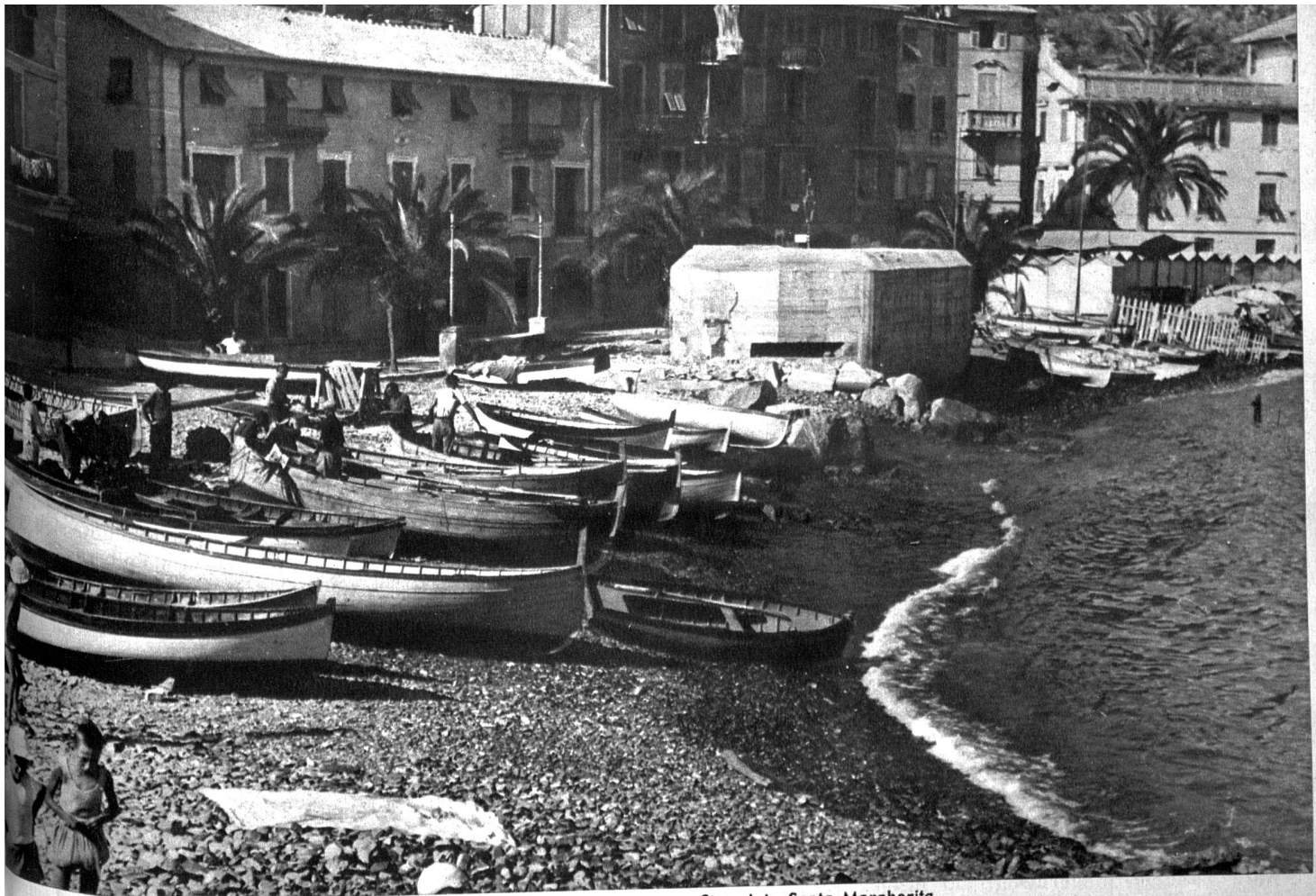
Deutsche Bunker stehen noch immer am Strand in Santa Margherita

...viele Fascisten in Amt und Ehren stehen, dass diese Fascisten sich nicht ducken, sondern recht sehr bemerkbar machten, aus Protest dagegen, dass die Regierung für die Partisanen keine Zeit noch Gehör mehr habe, und sie wieder in Formationen in die Berge gegangen. Was sie dort oben treiben, ob sie Messer schleifen oder Kugeln giessen, das ist unbekannt, denn die Partisanenberge sind für alle Nichtpartisanen gesperrt. Sicher ist, dass ein sehr grosser Teil der Bevölkerung mit den Partisanen sympathisiert. Welch ein gewaltiger Unterschied zwischen Adria und Ligurischem Meer!