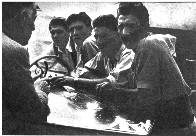
Junge Burschen hungern im Hafen von Portofino herum und warten darauf, Fremdenführer zu spielen