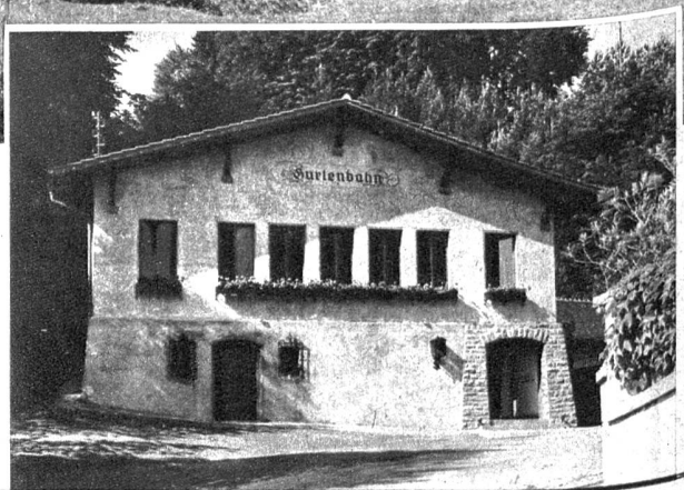
Die Talstation der Gurtenbahn