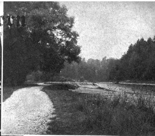
Auch das Eichholz, der schöne Strand an der Aare, gehört zur Gemeinde Köniz

alten Waberer schworen auf die Zuverlässigkeit der Voraussagen Lättfuhrme-Köbus, was auf die des Zürcher Laubfroschs, der seine unverbindliche Wettermeinung täglich ein paar Mal durchs Radio quakt, heutzutage keiner mehr tut.