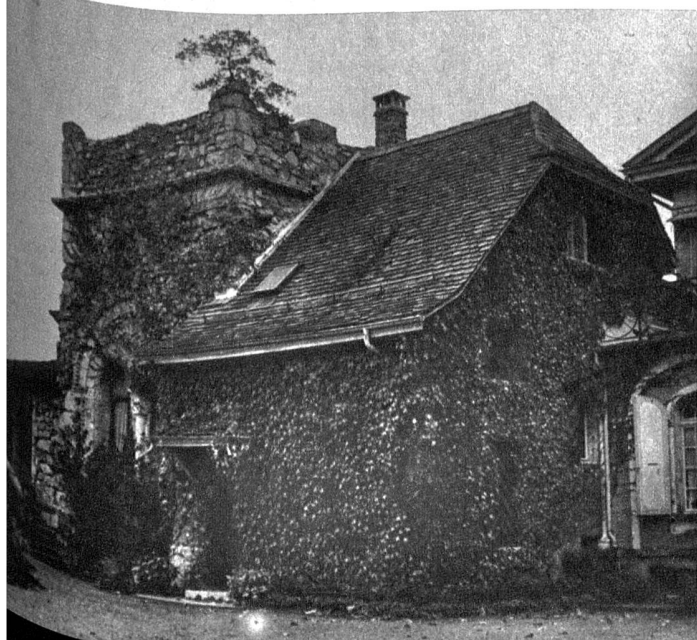
Das Gossetgut in Wabern in seinem heutigen Zustand