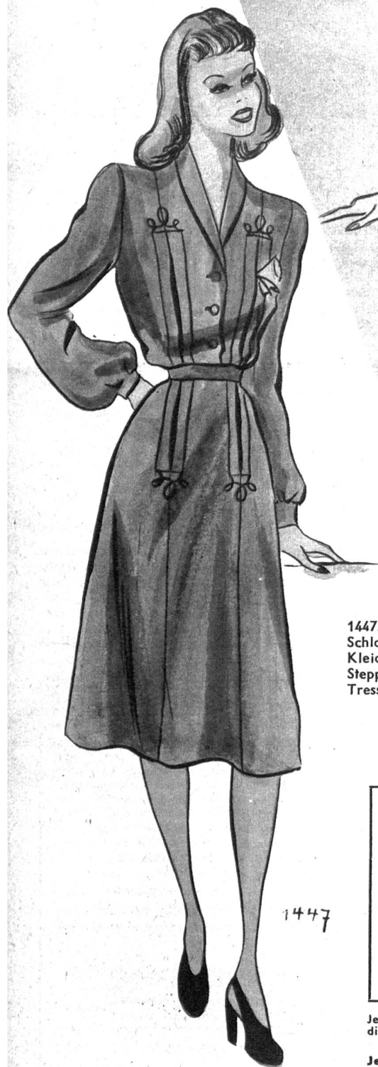
1447. Schlankmachendes Kleid mit Schalkragen, Stepparbeit und Tressengarnitur