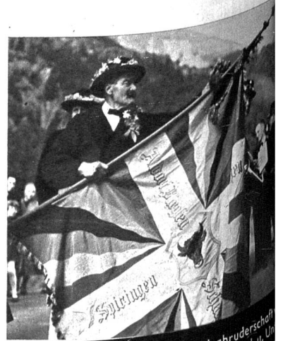
Die prächtige Fahne der Aelplerbruderschaft Altdorf, Bürglen, Spiringen, Schächental u. Unterschächen, die jedes Jahr aufs neue gesegnet