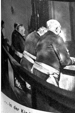
... in der Kirche nach der Alpabfahrt