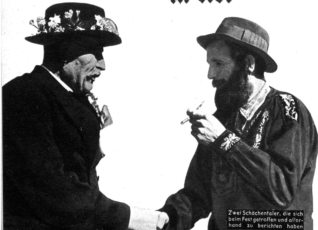
Zwei Schächentaler, die sich beim Fest getroffen und allerhand zu berichten haben