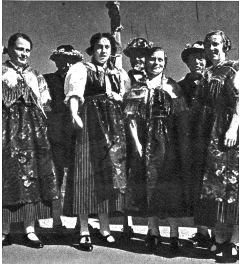
Da würden noch ganz andere begeistert schmunzeln, nicht nur die Ehrensennen, wenn sie von solch prächtigen Urner Meitli eingerahmt würden