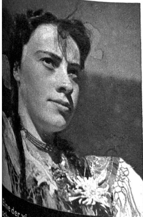
Eine der vier Ehrenjungfern in ihrer geschmückten Landestracht mit dem kunstvoll gearbeiteten Haarpfeil