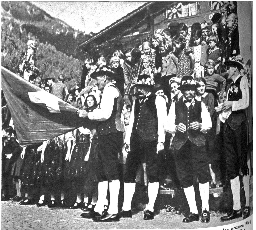
Die vier Ehrensennen, die ältesten der Aelplergemeinschaft, treten einzeln in den grossen Ring der zahlreichen Zuschauer, um ihre Kunst im FahnenSchwingen unter Beweis zu stellen

Im Volksleben nehmen Genossenschaften verschiedener Art einen breiten Raum ein. Uri ist reich an solchen, speziell Altdorf. Die volkstümlichste unter ihnen ist die Verbrüderung der Sennen und Aelpler von Altdorf, Schattdorf, Bürglen, Spiringen und Unterschächen, die 1593 errichtet wurde und alljährlich am 2. Sonntag im Oktober zu Bürglen ihre Chilbi mit Gottesdienst und FahnenSchwingen feiert. Dieses Fest steht am Ende der Alpabfahrt, an dem Herz und Gemüt ihren Anteil haben und an dem die Sennenleute in schmuder Landestracht hinter dem Fähnrich einherschritten, zur Kirche zum Segengottesdienst, wo der Pfarrer die Fahne segnet. Diese Chilbi gehört wohl zum köstlichsten, was wir als Abschluß der Alpzeit im Urnerland buchen können.