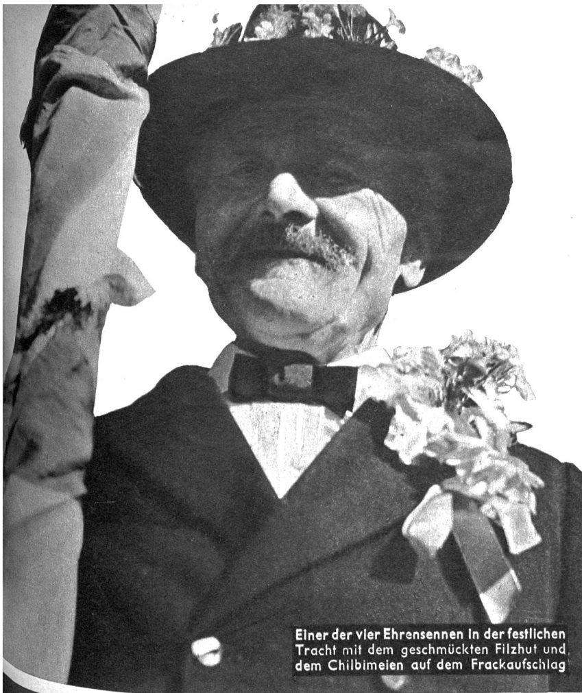
Einer der vier Ehrensennen in der festlichen Tracht mit dem geschmückten Filzhut und dem Chilbimeien auf dem Frackaufschlag