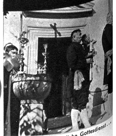
Der feierliche Gottesdienst