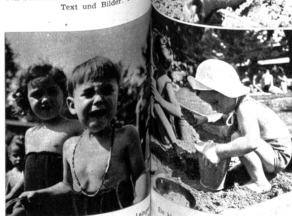
Was ist wohl hier passiert? Ist der Tunnel eingestürzt oder das Werkzeug zum Bauen verloren gegangen?

Ein Regenschauer löscht dann aus den fleissigen Händen über Tag geformt und zertrümmert, und wie ein unbeschriebenes Blatt steht der Sandkasten andernfalls wieder zur Verfügung.