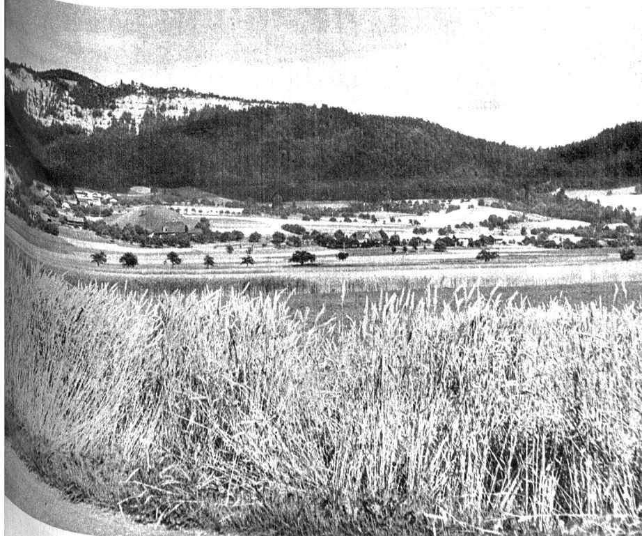
Unterwegs von Burgdorf nach Thun