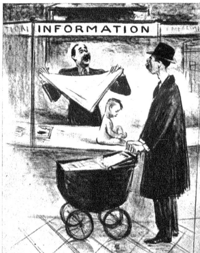
«Dann halten Sie sie auf diese Weise.»