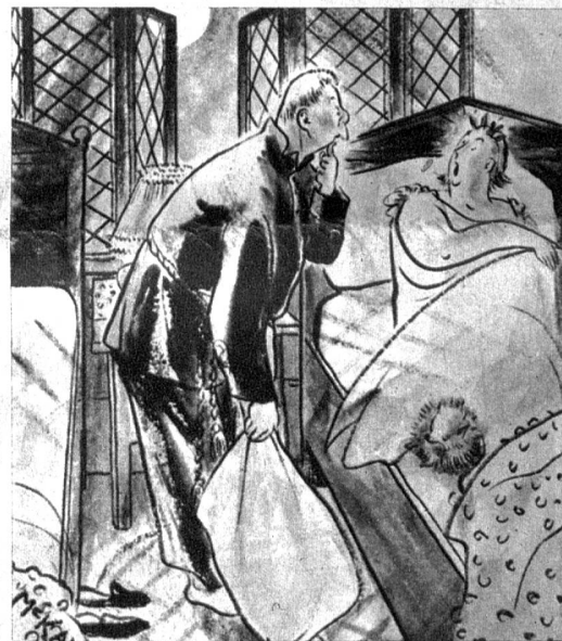
«Wenn dir kalt ist, warum schliessest du nicht das Fenster?»