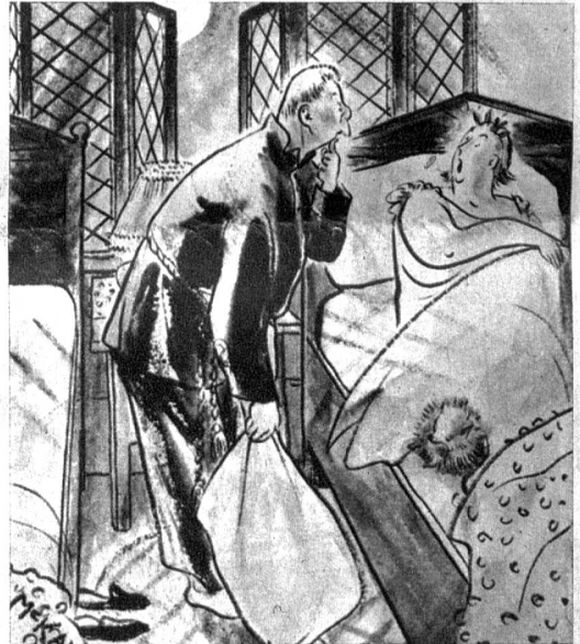
«Wenn dir kalt ist, warum schliessest du nicht das Fenster?»