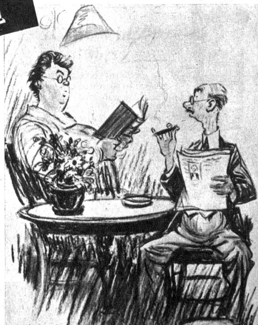
«Es tut mir leid, dass wir neue Brillen gekauft haben, wir waren viel glücklicher miteinander, als wir uns nicht so genau betrachten konnten.»