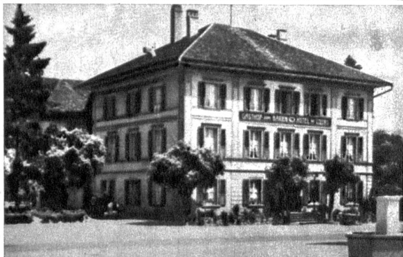
Hotel Bären, Münchenbuchsee

Höflich empfiehlt sich W. Wagner-Meyeneth