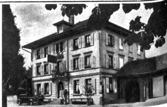
Restaurant Löwen, Münchenbuchsee

Das Haus für Hochzeiten und Anlässe Besitzer: R. Vogt, Küchenchef. Telefon 791 28