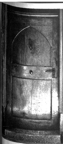
Türe in gotischem Stil, an der Kessergasse 44