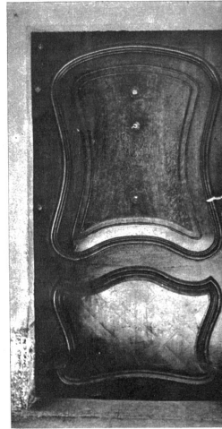
Türe am Haus Postgasse 44, mit schöner Holzbearbeitung und weit ausholender Linienführung