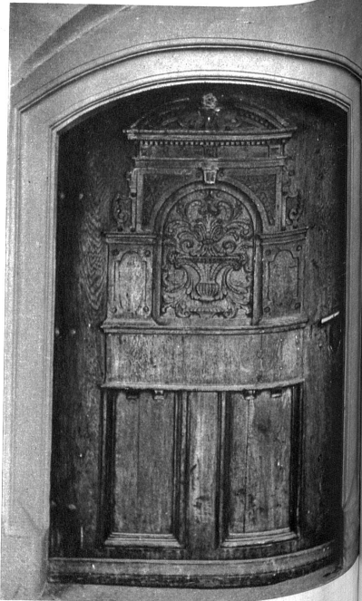
Alte Renaissance-türe aus der ersten Hälfte des 17. Jahrhunderts am Hause Gerechtigkeitgasse 19, auf die die Bewohner der Gasse besonders stolz sind