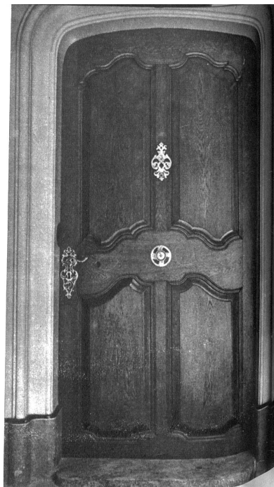
Mustergültige Barocktüre des Hauses Kessergasse 2. Nur der fehlende Türklopfer sollte ersetzt werden