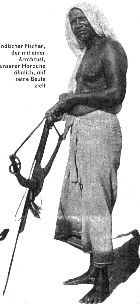
Indischer Fischer, der mit einer Armbrust, unserer Harpune ähnlich, auf seine Beute zielt

festen Fuss fasste, sondern die noch unter Elisabeth gegründete Ostindische Kompagnie , eine Aktiengesellschaft. Mit der Zeit erhielt diese vermehrte Rechte, Truppen aufzubieten, Verträge abzuschliessen usw. Während des 7jährigen Krieges erwarb sich der energische Clive Bengalen und besiegte die Franzosen und die mit ihnen verbündeten Inder. Eine der wichtigsten Waffentaten war sein berühmter Sieg von Plassey, 1757. In der Folge wurde nun ein Generalgouverneur ernannt. Erster Generalgouverneur war Warren Hastings , der die britische Herrschaft erweiterte, leider nicht immer mit einwandfreien Mitteln. Die Beamten in Indien sammelten sich oft Riesenvermögen an. Warren Hastings wurde abberufen und es wurde ihm in England der Prozess gemacht. Das 7 Jahre lang dauernde Gerichtsverfahren endete schliesslich mit einem Freispruch, weil Warren Hastings im Interesse Englands gehandelt habe.