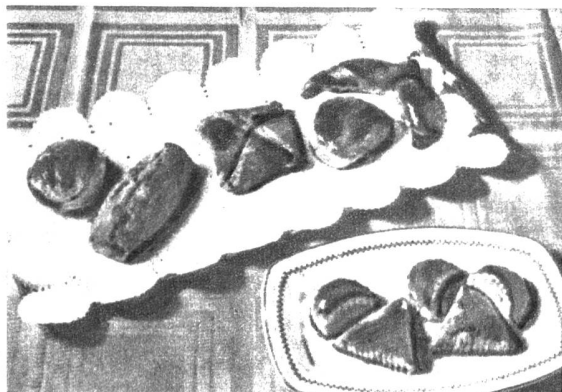
Pastetchen und Fleurons aus Blätterteig in verschiedenen Formen

Man schneidet aus Blätterteig runde Fladen, die man mit einer Quarkmasse aus 200 g Quark, 1 Eigelb, 30 g Zucker, einigen Sultaninen und 1 Löffel saurer Sahne füllt. Die Ränder werden eingedrückt und die Fladen rasch in grosser Hitze gebacken.