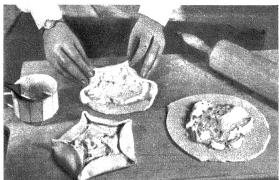
Die Osterfladen werden mit Quarkmasse gefüllt