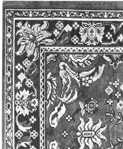
Jeder Orientteppich wird in tausende von winzigen Quadraten aufgeteilt, ehe er für die Industrie „kopiert“ wird. Für die Zeichnung und Kolorierung seines Entwurfes, der stets etwas vereinfacht, braucht der Kolorist Monate

Die Nachahmung in Technik, Farbgebung und Motiv der berühmten orientalischen Teppiche ist seit vielen Jahrzehnten von der Industrie vermehrt worden. Diese Teppiche sind meist nicht gewoben, sondern geknüpft, handgeknüpft. Gerade die Anstrengungen der Schweiz sind in dieser Hinsicht bemerkenswert, besitzen wir doch hier eine europäisch anerkannte Fabrik, die diese Knüpftechnik, in etwas vereinfachtem Masse (was zum Beispiel dadurch erreicht wird, dass auf ein cm 2 Grundmuster statt 24 nur 8 Knoten eingefügt sind, so dass bei gleichbleibendem Muster technische Erleichterungen möglich sind), in vorzüglicher Qualität, Material und Farbgebung anfertigt. Der Orientteppichzeichner muss nicht nur ein guter, zuverlässiger und farblich routinierter Künstler seines Faches sein, sondern vor allem auch Webachmann, der weiss, was sich industriell auswerten lässt und was nicht. Wir haben Herrn Keller, einen Aus-