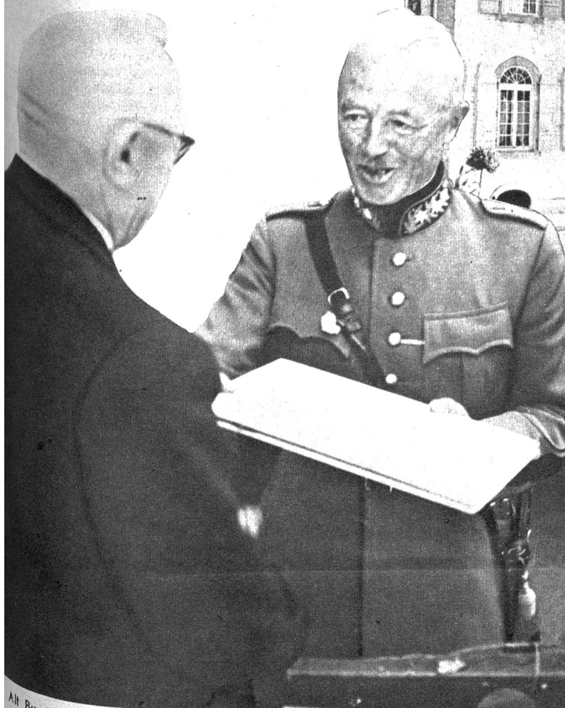
Alt Bundesrat Minger überreicht General Guisan die Ehrenurkunde