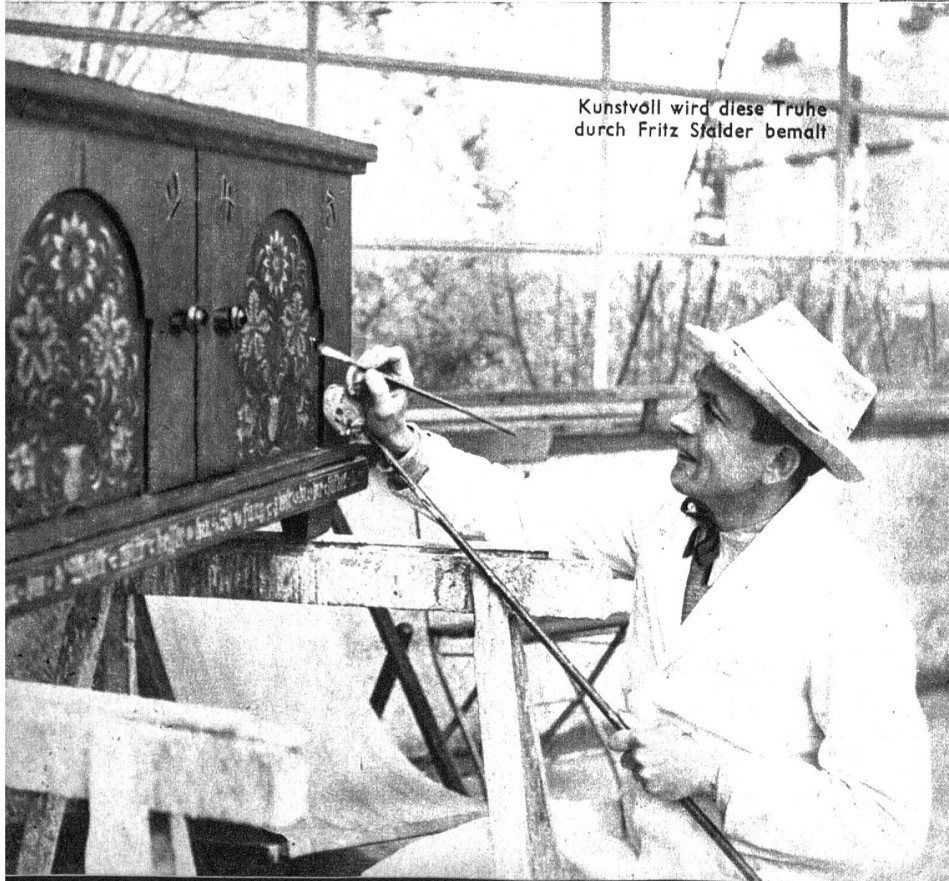
Kunstvoll wird diese Truhe durch Fritz Stalder bemalt

anzutreffen und mancher Trog wurde aufgerichtet und erhielt wieder seinen Ehrenplatz in der Wohnstube. — Dies war nur möglich dank langjähriger Pionierarbeit und dank dem unermüdlichen Schaffen und Können einiger tüchtiger Fachleute.