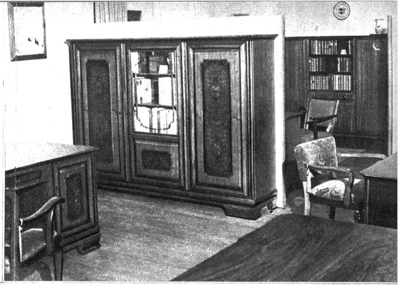
Aufs schönste ausgearbeitete Möbel warten in den Ausstellungsräumen auf ihre Verwendung

Aus solchen Verhältnissen heraus ist auch die Entstehung der Möbelfabrik in Fraubrunnen zu verstehen. Zuerst war es eine kleine Schreinerei mit einem recht beschränkten Wirkungsgebiet, das sich aber durch die Nachfrage rasch