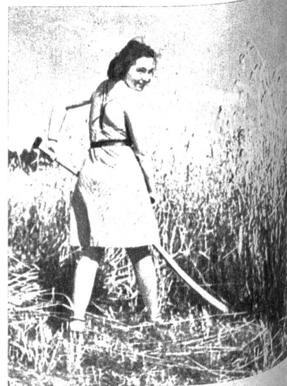
Mädchen im Länddienst