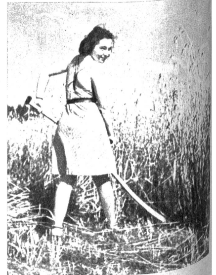
Mädchen im Landdienst