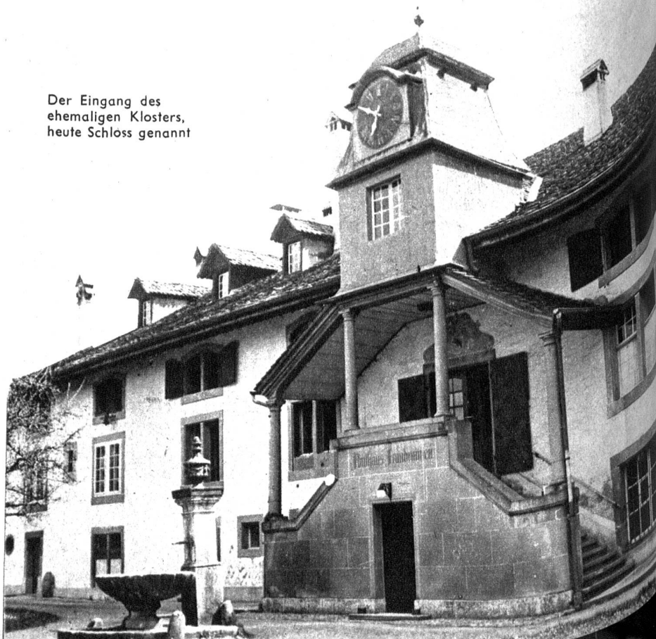
Der Eingang des ehemaligen Klosters, heute Schloss genannt