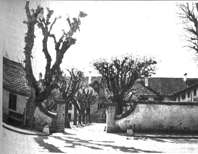
Der Eingang zum Klosterhof, respektive Schlosshof