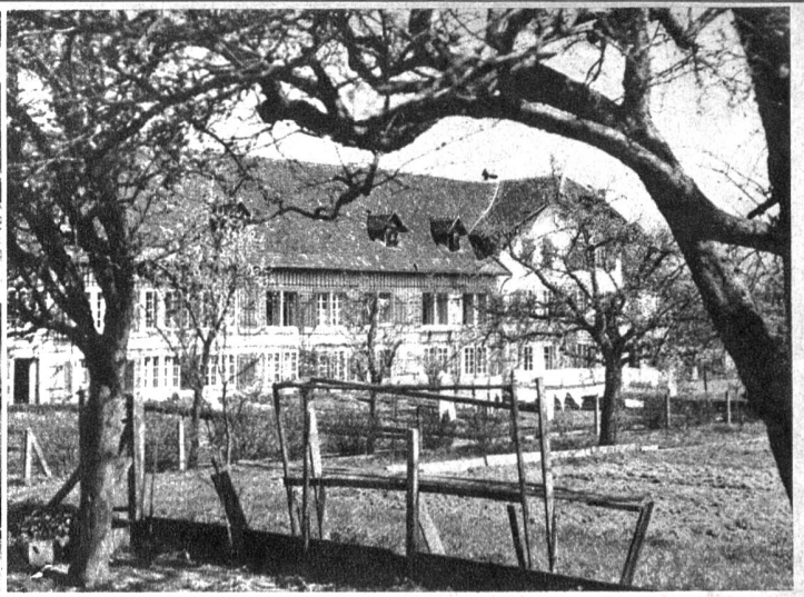
Die Südseite des Klosters

Buchegg, Strättligen, Signau, Sumiswald, Griesenberg, Erlach. Des Klosters Ruhe wurde arg gestört, als die Gugler unter Ingelram von Councy (Schwiegersohn des englischen Königs) im Dezember 1375 auch den Oberaargau brandschatzten. Einer der Hauptleute, Ivo banner von Bern brach am 26. Dezember auf und überrumpelte die Gugler. Der Feind erlitt mit 800 Toten eine blutige Niederlage. Man sang in Bern das Guglerlied: