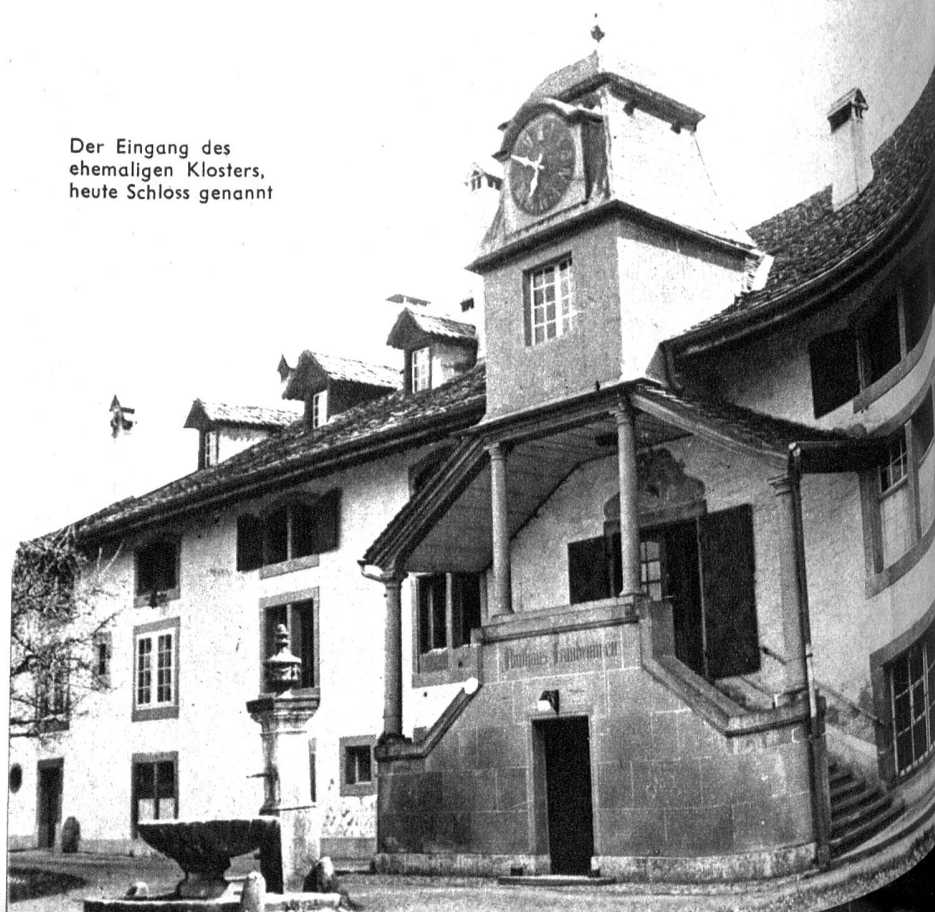
Der Eingang des ehemaligen Klosters, heute Schloss genannt