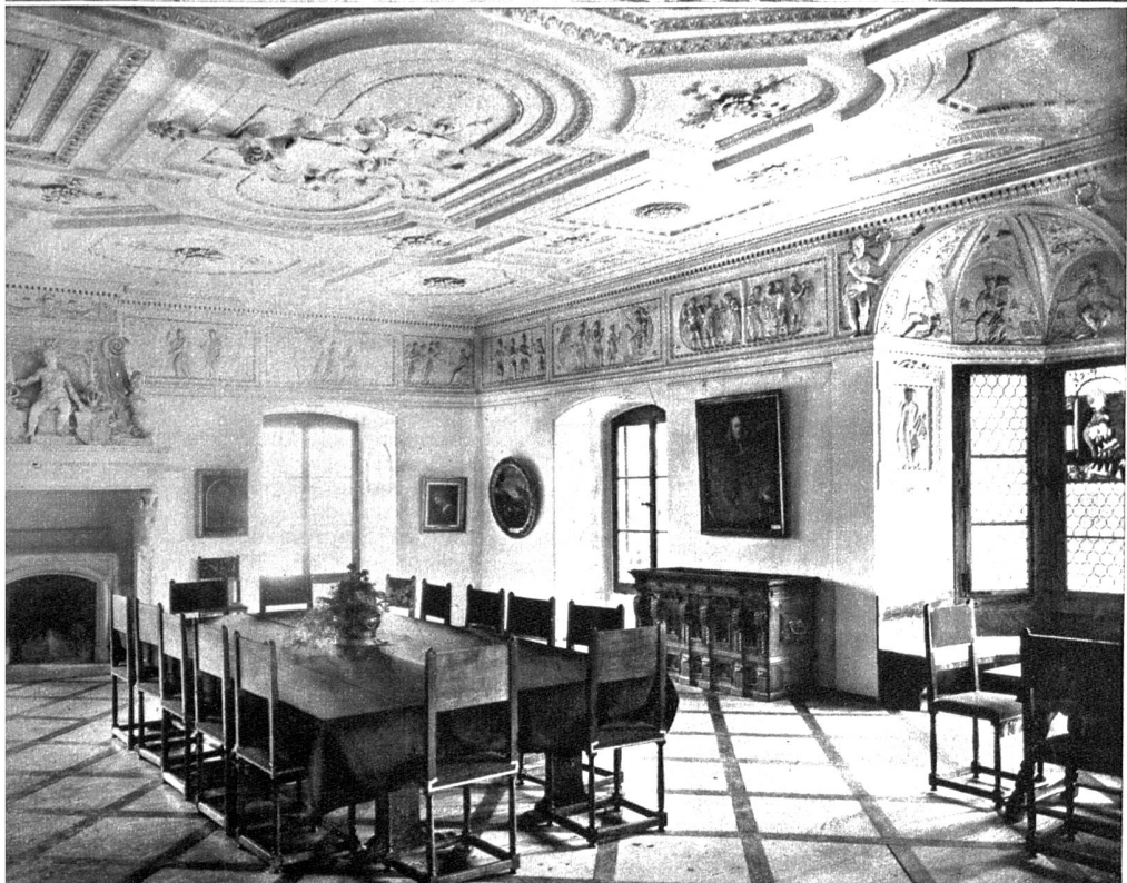
Links oben: Altes typisches Bauernhaus bei Spiezwil * Mitte links: Das Schloss Spiez von der Westseite mit dem grossen Turm und dem Treppenturm * Links unten: Der von Franz Ludwig von Erlach im Jahre 1614 erbaute Festsaal im Schloss Spiez * Rechts: Weinberge über dem Thunersee. Rechts das Schloss Spiez