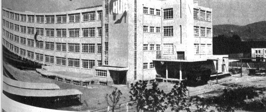
Die Fabrik in Dulliken 1933