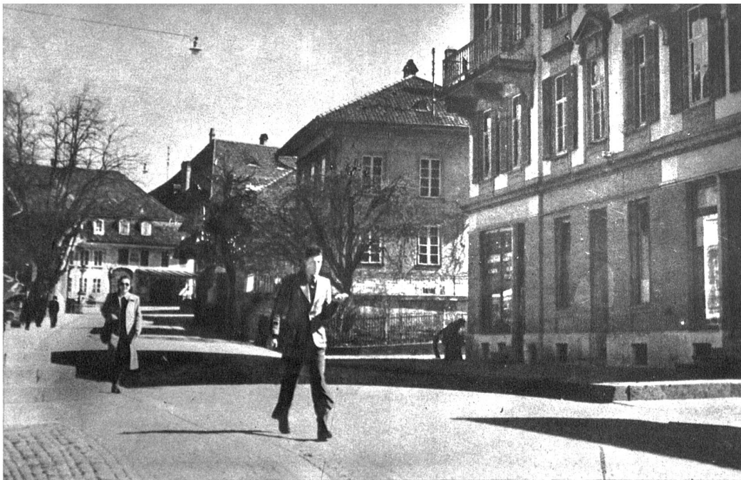
Partie an der Bern-Zürich-Strasse