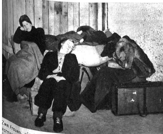
Zwei Frauen, ein junges Mädchen und ein Kind — alle in langen, warmen Strümpfen, einige Koffer, Decken. Wohin führt der Weg? Sie wissen es selber nicht. Ausgewiesen, unerwünscht. Heim ins Reich

Anders in Oesterreich, unserem, von vier Mächten besetzten Nachbarland im Osten. Zwar zirkulieren im Verhältnis zu Deutschland, dank der elektrischen Traktion, der Unabhängigkeit von der Kohle, ziemlich viele Züge. Die Zonenschranken jedoch erweisen sich für einen geordneten Zugverkehr als gewaltiges Hemmnis. Der einzige Zug, welcher diese Mauer «überklettert», ist der Arlbergexpress, welcher Paris mit Wien verbindet und bereits dreimal wöchentlich fahrplanmässig verkehrt. Jeder Bahnhof in Oesterreich bietet heute ein Bild grösster Trostlosigkeit. In den Restaurationsräumen und den Wartsälen drängt sich eine hoffnungslose Menschenmenge, demobilisierte Wehrmachtsangehörige, Rückwanderer aus dem Reich, aus Oesterreich ausgewiesene Reichsdeutsche, und je nach der Zone französische, amerikanische oder englische Soldaten. Alle verbindet der gemeinsame Wunsch, es möchte sich möglichst bald eine Fahrgelegenheit bieten. Aber bis ein Zug heranbraust, vergehen endlose Stunden — und durch die leeren Tür- und Fensterrahmen bläst eine eisige Biese. Da sitzen und liegen sie dann, die Menschen ohne Heimat, versuchen, in ihre Mäntel und Decken eingewickelt, auf Bänken oder auf dem Fussboden einzuschlafen, Hunger und Kälte zu vergessen. Kleinbahnidyll? Nein! Tragik eines kleinen Ländchens.