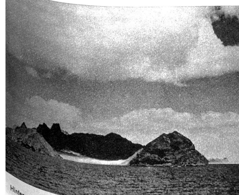
Hinter steilen Felswänden geborgen liegt der britische Flottenstützpunkt Aden, der den Eingang in den Indischen Ozean beherrscht

Rechts: Arabische Händler klettern an den Masten ihrer Segelboote empor, um ihren Kram auch dann an den Mann zu bringen, wenn ihnen das Betreten des Schiffes verboten ist. Links: Selbstbewusst schauen die arabischen Frauen in die Welt, seitdem sie nicht mehr gezwungen sind, unter schwarzem Schleier ihre Schönheit zu verbergen