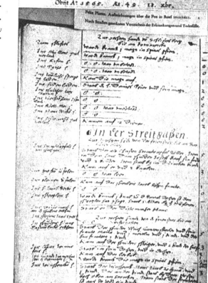
D. CONRADUS GESNERUS ARCHIATRUS TIGURINUS, PROFESSOR PHYSICIS Obit A. 1565. Aet. 49. 13. Xbr.

Conrad Gessner Geboren 26. März 1516, gestorben 13. März 1565 in Zürich. Neben seiner Tätigkeit als Arzt und als Lehrer der Physik fand er noch Zeit, die «Bibliotheca universalis» zusammenzustellen, mit der er der Begründer der Bibliographie geworden war. Leider konnte Gessner sein verheissungsvolles Werk, die Botanik, nicht zum Abschluss bringen, der Nachlass wurde erst später bearbeitet. Gessner hat als einziger unter seinen Zeitgenossen die Blüten und Samen der Pflanzen bis in alle Einzelheiten betrachtet und ihren Wert für die Bestimmung der Verwandtschaft erkannt. Als Erforscher der Flora und Fauna der Alpen führte er das für die damalige Zeit erstaunliche Unternehmen einer Pilatusbesteigung aus. 1553. Wohl als erster hat er Abbildungen von Kristallen und Petrefakten veröffentlicht.