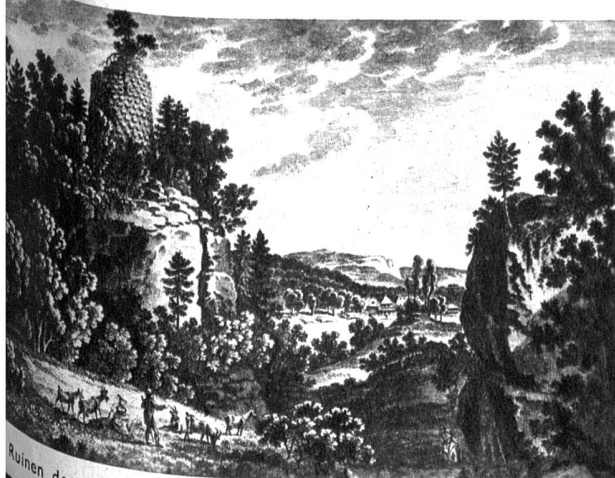
Ruinen des Schlosses Geristein nach einem Stich von G. Lory