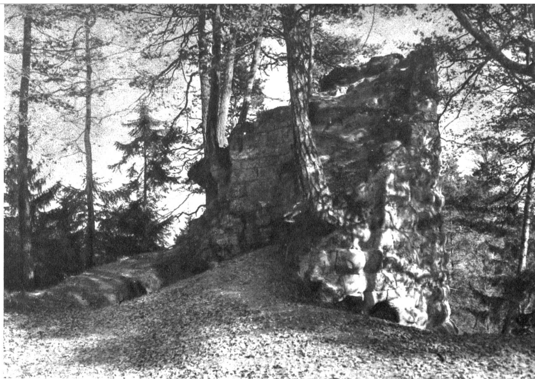
Die heutigen Ruinen der Ritterburg Geristein oberhalb Bolligen

von der einstigen Burg den Namen erhalten hat und heute einen Schulbezirk der ausgedehnten Gemeinde Bolligen bildet. Von Bolligen aus erreicht man das romantische, abgegrenzte Dörflein auf einem prächtigen Wanderweg, der die Landstrasse meidet und über den ein-gelegenen Bauernweiler Flugbrunnen zur Hochterrasse des Dörfchens Bantigen emporsteigt. Auf dem alten Römerweg durchs Bantigental, das zwischen den waldbedeckten Höhen der Stockeren und des Bantigers verlassen liegt, erreicht man den romantischen Hügel von Geristein. Unterwegs streift man das kleine versteckte Tälchen bei Harnischhut. Im Kriege mit der Stadt Bern sammelte der Graf von Kyburg 1333 im Aargau viel Kriegsgenossen Bern. Ähnlich wie es früher König Rudolf bei der Schosshalde getan hatte, wollte er die Berner aus ihrer festen Stadt herauslocken, um sie ausserhalb ihrer Mauern zu schlagen. In einem Hinterhalt bei Geristein versteckte er den grössten Haufen seiner Leute und liess nur wenige gegen die Stadt reiten. Er dachte, die Berner würden in