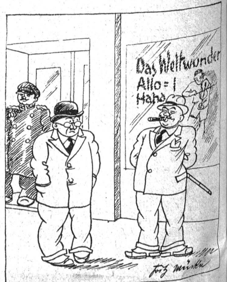
Haben Sie den siebenjährigen Violinkünstler Allhoha schon gehört? Ja, vor 14 Jahren in Zürich