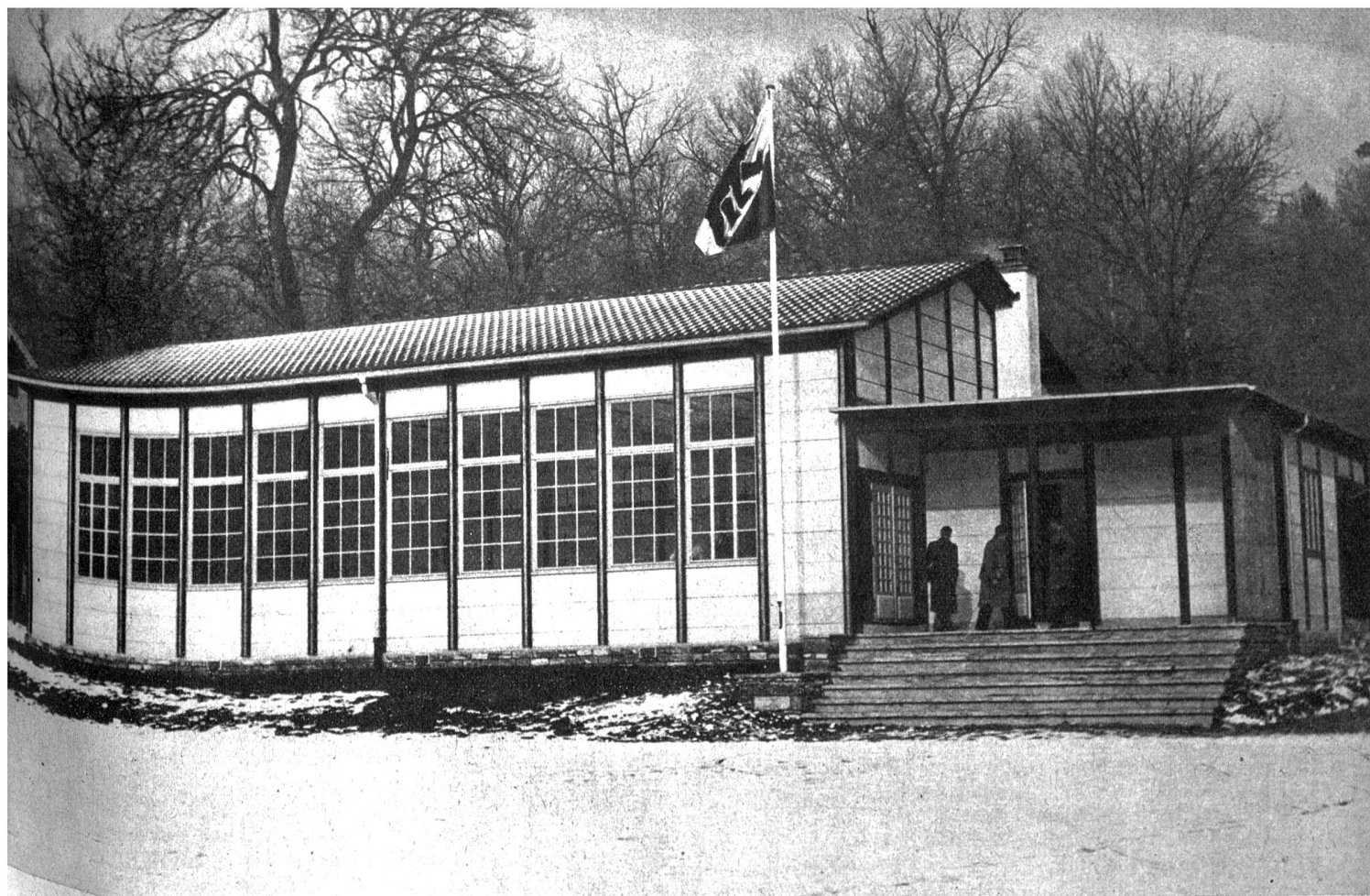
Sportplatz und Uebungshalle der Universität Bern

Rechts: Der Hochschul-Sportlehrer erläutert eine Phase der körperlichen Uebung. Die neuartige, in der bewährten Durisol-Leichtbauweise konstruierte Uebungshalle mit viel Licht und Luft wirkt befreiend gegenüber den alten Turnhallen, die wie Keller- gewölbe und Bunkerbauten anmuten