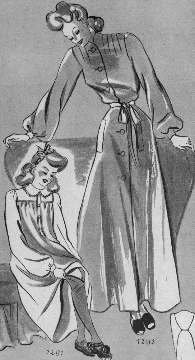
1291. Nachthemd für kleine Mädchen aus warmem Stoff