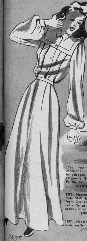
1295. Nachthemd aus Barchent, das mit oder ohne Gürtel getragen werden kann. Origineller Gölter und breite Falten, die in den Kanten abgesteppt sind