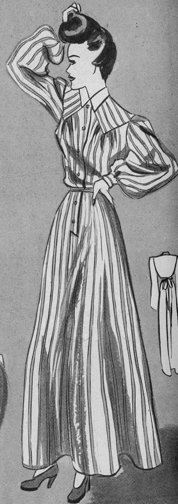
1293. Nachthemd aus gestreiftem Barchent