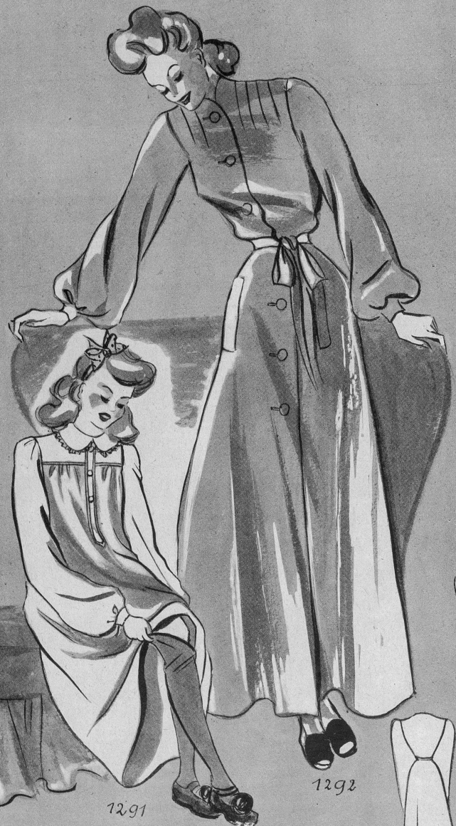
1291. Nachthemd für kleine Mädchen aus warmem Stoff 1292. Hausdress in praktischer, einfacher Form, hoch geschlossen, mit modernen Längstaschen