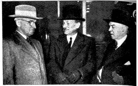
Die Herren der Atombombe. Präsident Truman (links), Premierminister Clement Attlee (Mitte) und der kanadische Regierungschef Mackenzie King (rechts) haben beschlossen, das Geheimnis der Atombombe den Vereinigten Nationen zur Verfügung zu stellen, wenn die Vorbedingungen hierzu erfüllt sind.