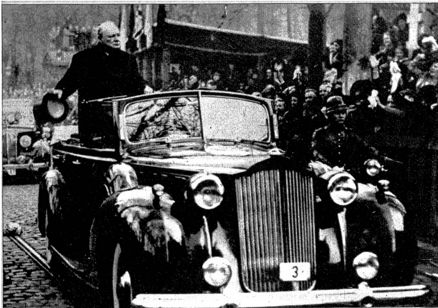
Der „private“ Besuch Winston Churchills in Belgien und vor allem in Brüssel gestaltete sich zu einem wahren Triumphzug des englischen Staatsmannes, welchen das ganze belgische Volk als Freund und Befreier verehrt. — Unser Bild: Churchill auf seiner triumphalen Fahrt durch die Strassen Brüssels. Zehntausende jubelten dem ehemaligen englischen Premier begeistert zu.