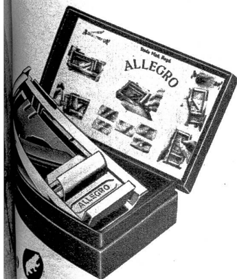
Plastieren ist der Herren Plage. Mit Klingenschleif- und Abziehapparat aber wird es zur Freude