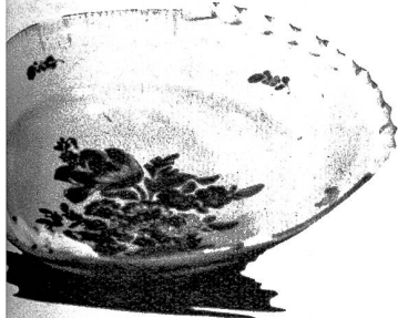
Die schöne Keramikplatte findet vielfache Verwendung und dürfte mancherorts Freude bereiten