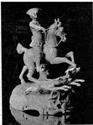
Ist sie nicht schön, diese Porzellanfigur. Ein solches Geschenk wird sicher immer erfreuen