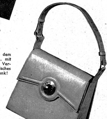
Eine schöne Tasche in dem modernen hellen Ton, mit einem interessanten Verschluss. Welch praktisches und beliebtes Geschenk!