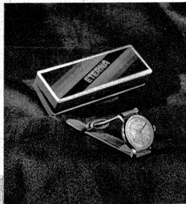
Die gute, zuverlässige Armbanduhr ist wertvoll und geschätzt