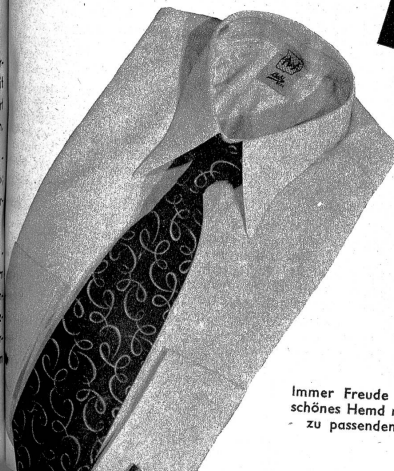
Immer Freude bereitet ein schönes Hemd mit einer dazu passenden Krawatte