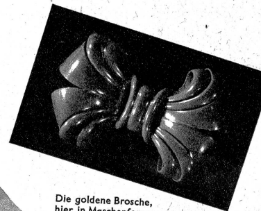
Die goldene Brosche, hier in Maschenform, ist ein schönes bleibendes Geschenk