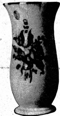
Die handgemalte Vase aus Porzellan oder Keramik dürfte an manchem Ort willkommen sein