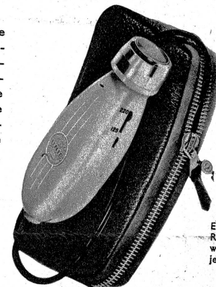
Ein elektrischer Rasierapparat wünscht sich bestimmt jeder Herr