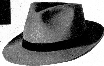
Ein neuer Hut ist der geheime Wunsch so manchen Jünglings und Herrn