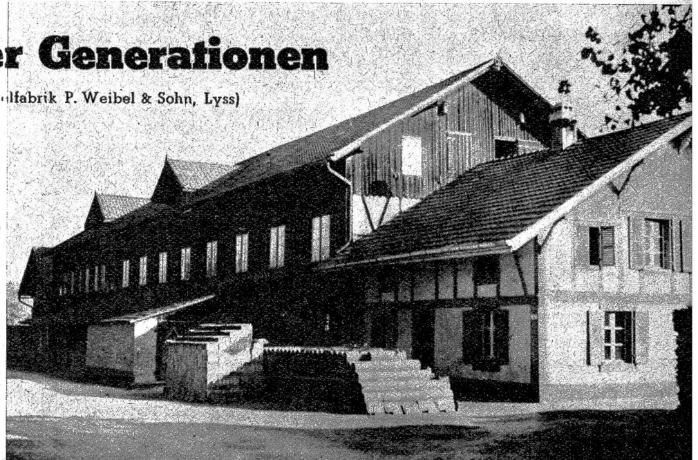
Teilansicht der Ziegelfabrik P. Weibel & Sohn in Lyss

Der Boden im technischen als auch im volkstümlichen Sinne ist in erster Linie massgebend für die Zukunft eines Ziegeleiunternehmens, und es ist nicht zu verwundern, wenn die Güte des Bodens auch auf eine Tradition im Gewerbe von entscheidendem Einfluss sein kann. Diese Zähigkeit des Festhaltens am väterlichen Erbe in gewerblicher Tätigkeit hat Peter Weibel schon aus dem Ziegeleibetrieb seines Vaters in Ettiswyl mitgebracht, als er im Jahre 1876 in Lyss eine Ziegeleifabrik errichtete, deren Betrieb schon damals maschinell eingerichtet war. Dabei kamen ihm nicht allein die Erfahrungen aus seiner Lehrzeit beim Vater zugute, sondern auch diejenigen, die er sich als Betriebsleiter der Ziegeleibetriebe in Neuenburg und später in St. Immer erworben hatte. Neben den üblichen Ziegeleiprodukten, welche zur damaligen Zeit hergestellt wurden, hatte Peter Weibel auch die Herstellung von Falzziegeln schon von Anfang an betrieben, was ihm einen bedeutenden Vorsprung vor anderen Unternehmen sicherte. Sein Vater war der erste in der Schweiz, der überhaupt die Falzziegel herstellen konnte, und die Ziegelei in Ettiswyl blieb in dieser Hin-