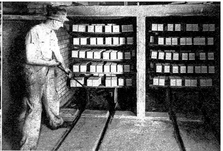
Die Backsteine werden aus der Trocknerei ausgefahren