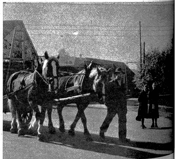
Ein fleissiges und arbeitsames Volk lebt in Lyss

Ein weiteres Bahntracé berührt Lyss seit 1876, nämlich die Broyetalbahn, mit Fortsetzung über Solothurn nach Herzogen-