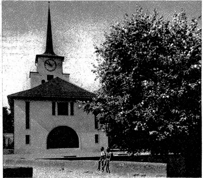
Die neue Kirche in Lyss, die 1936 eingeweiht wurde

Mit dieser Entwicklung hat auch das Ortschaftsbild eine Veränderung erfahren. Vieles ist verbessert und verschönert worden. Zur Aufnahme der stets zunehmenden Bevölkerung sind neue Quartiere entstanden, die sich in jeder Beziehung gut präsentieren. Die alten, zum Teil noch mit Stroh oder Schindeln gedeckten Hütten innerhalb des Dorfrayons mussten Geschäftshäusern Platz machen, die wirkungsvoll dastehen. Der Lyssbach, dessen Wasserkräfte geschätzt sind, der aber durch Ueberschwemmungen oft viel Unangenehmes gebracht hat, ist mit grossem Kostenaufwande verbaut worden. Die Gemeinde ist besonders stolz auf dieses Werk. Auf eine Verbesserung der Verkehrsverhältnisse wurde hingearbeitet durch Verbreiterung