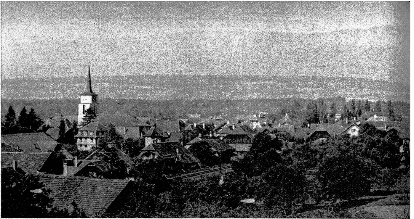
Blick vom «Murgeli» über das Dorf