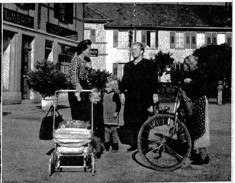
Auf dem Weg zu den täglichen Einkäufen