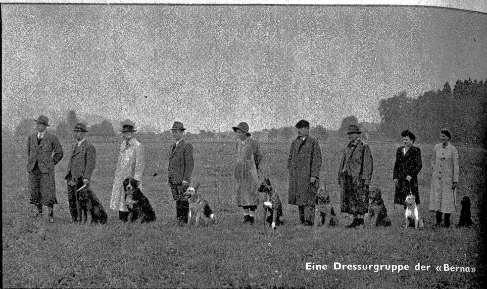
Eine Dressurgruppe der «Bern»

Sektion Bern der Schweiz. Kynologischen Gesellschaft (SKG)