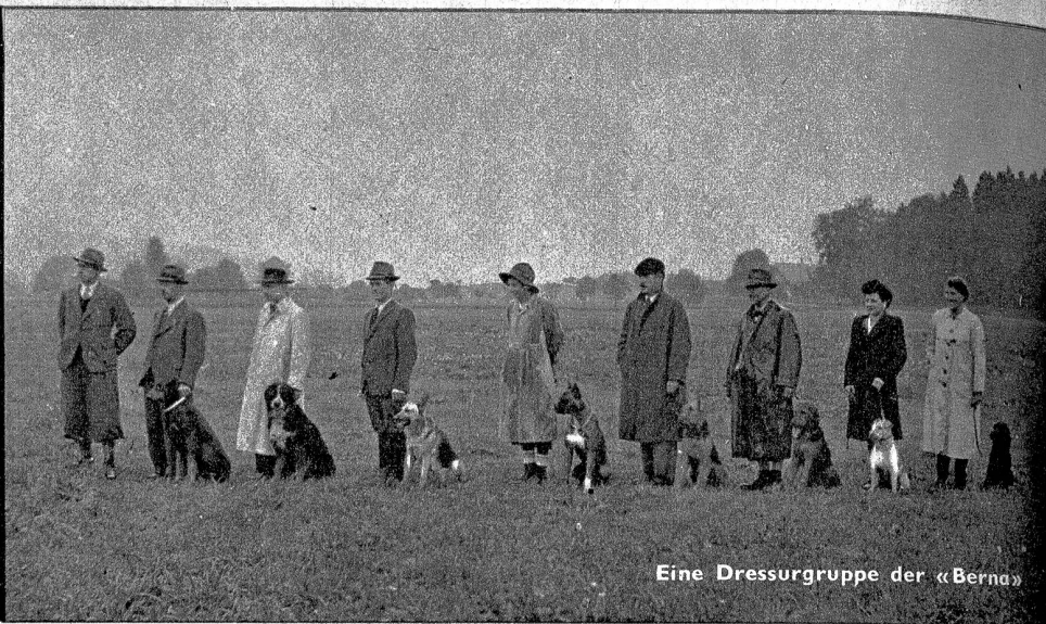
Eine Dressurgruppe der «Bern»

Sektion Bern der Schweiz. Kynologischen Gesellschaft (SKG)